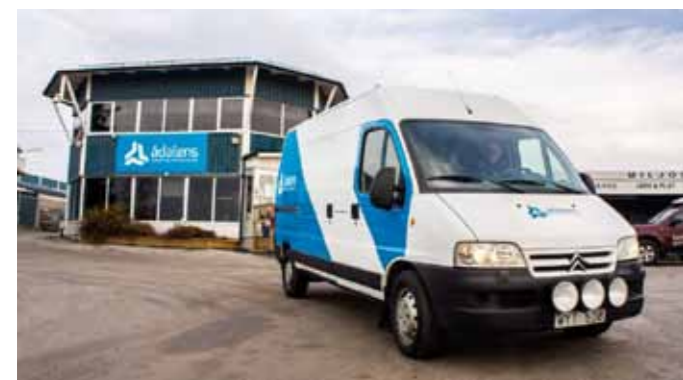
Nya loggan syns både på butiken och på bilarna.

Det är ett experiment som har fungerat bra. Många använder